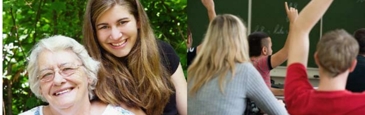
Jung und Alt sollen sich begegnen, Jugendliche und Senioren voneinander lernen – das will das CJD möglich machen.