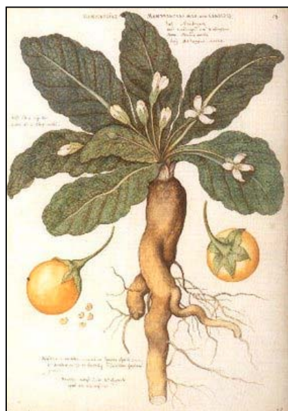
Abb.4: Mandragora 8

Die Mandragora oder Alraune ist eine der bekanntesten Hexenzutaten. Sie ist an ihrer Wurzel zu erkennen, die einer menschlichen Gestalt ähnelt. Wegen ihrer schlaffördernden, aphrodisischen und abführenden Wirkung war sie bei den Hexen sehr beliebt. Man musste allerdings Vorsicht walten lassen bei der Beschaffung der Wurzel, da sie laut der Legende sobald sie die Erde verließ einen markerschütternden Schrei ausstieß, der jedes Lebewesen in den Wahnsinn trieb.