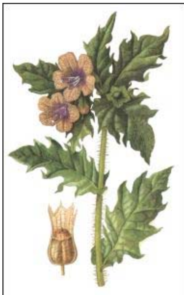
Abb. 1: Bilsenkraut 2

Als giftige Pflanze wurde Bilsenkraut oft für dunkle Praktiken genutzt. Die Hexen verbrannten es zum Beispiel um durch die entstehenden Dämpfe Dämonen hervorzulocken. Aß man die Pflanze, führte dies zu Wahnsinn oder sogar zum Tod.