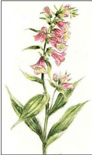
Abb.2: Fingerhut 4

Der Fingerhut ist ein Beispiel für eine von Hexen verwendete Zutat für ihre Arzneien, die heute tatsächlich immer noch Verwendung in der Medizin findet. Während die meisten Hexenkräuter eine rein psychosomatische Wirkung hatten, ist in den Blättern des Fingerhutes die Droge Digitalis enthalten, die sich als ein wirksames Arzneimittel in der Behandlung von Herzbeschwerden und Herzschwäche und zum Abführen von überschüssigem Salz und Wasser erwies. Für die Medizin entdeckt wurde der Fingerhut, als ein englischer Arzt von einer Hexe hörte, die einen an Wassersucht leidenden Patienten mit einem Heiltrank behandelte, dessen Hauptzutat Fingerhut war. Dies