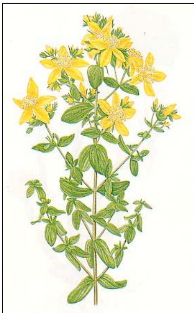
Abb.3: Johanniskraut 6

Obwohl Johanniskraut aufgrund seiner gelben Blüten als Pflanze der Sonne und des Guten angesehen wurde und deswegen oft als Mittel gegen Hexen und Dämonen verwendet wurde, findet es auch in der Hexenküche seinen Gebrauch. Das Johanniskrautöl wurde zum Beispiel zur Behandlung von Verbrennungen verwendet und auch bei Durchfall und Cholera war die Pflanze ein beliebtes Arzneimittel. Später wurde es christianisiert und nach dem Täufer Johannes benannt.