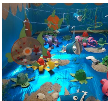
Ein Blick hinter die Kulissen: Vorbereitung der Ausstellung „KidS goes Amazonas“.